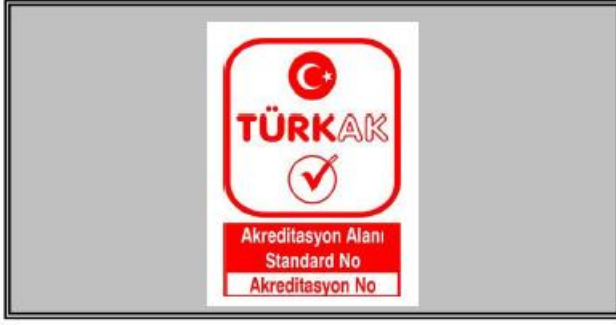
Şekil 4: TÜRKAK Akreditasyon Markasının Beyaz Zeminli Dokümanlar Haricindeki Dokümanlarda Kullanım Şekli

e) Bilgisayar ortamında hazırlanan markalar bu Rehber dokümanda belirtilen formatlar çerçevesinde veya TÜRKAK'ın elektronik ortamda sunduğu formatlar çerçevesinde hazırlanmalıdır.