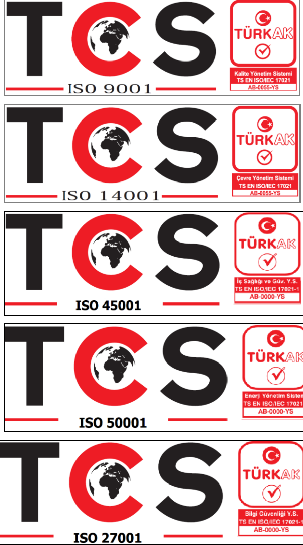
Şekil 6: TCS Belgelendirme'nin Logosu ve TÜRKAK Akreditasyon Markasının ilgili Sertifikada Kullanım Şekli

7.3 TCS Belgelendirme'den belge alan kuruluşlar, TÜRKAK Akreditasyon Markasını kırtasiye, reklam, tanıtım veya benzeri materyallerde kullanabilir. TÜRKAK Akreditasyon Markası akredite edilmiş belgelendirme kuruluşunun veya belgelendirme programının markası ile ilişkili olacak şekilde kullanılmalıdır. (Bakınız Şekil 6)