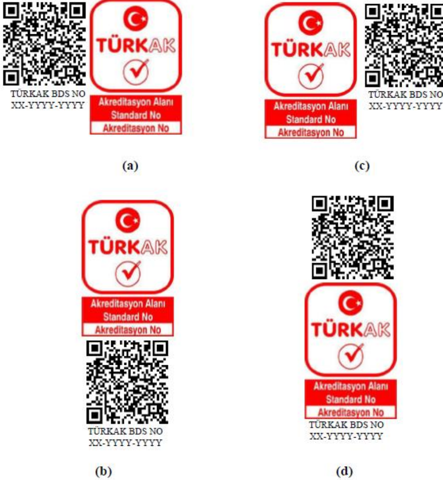
Şekil 8: TÜRKAK Belge Doğrulama Sistemi (TBDS) Kare Kod Konum Örnekleri

Söz konusu uygunluk değerlendirme faaliyeti hangi uluslararası akreditasyon birliğinin kapsamında ise yalnızca ilgili akreditasyon birliğinin adı yer alacaktır.