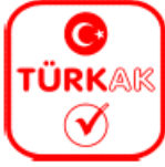
Şekil 1: TÜRKAK Logosu