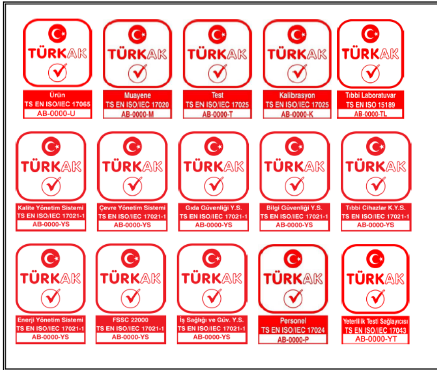
Şekil 5: TÜRKAK Akreditasyon Markası Örnekleri

6.9 TÜRKAK Akreditasyon Markası, tif, jpg, gif ve bmp formatlarında 50 mm genişliğinde TÜRKAK tarafından hazırlanmıştır. Hazırlanan değişik formatlardaki TÜRKAK Akreditasyon Markası örnekleri, akredite edilen kuruluşa teslim edilir veya kuruluşun erişimine açılır. TÜRKAK Akreditasyon Markasının belirtilen ebat haricinde kullanılması gerektiğinde, önceden TÜRKAK'ın onayı alınmalıdır. Şekil 5'te 25 mm ebatlı TÜRKAK Akreditasyon Markası örnekleri her bir akreditasyon standardı için ayrı ayrı verilmiştir.